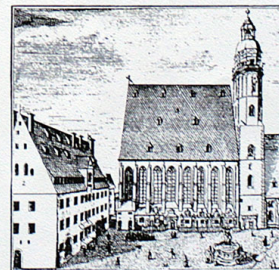
Die St. Thomas-Kirche, Leipzig, zur Zeit J. S. Bachs

Historische und diskographische Angaben zum Werk sowie die vollständigen Gesangstexte sind jeweils in einer zweiten Beilage enthalten.