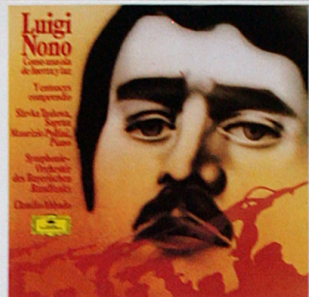
© 2530 436 In Italia disponibile con una diversa copertina