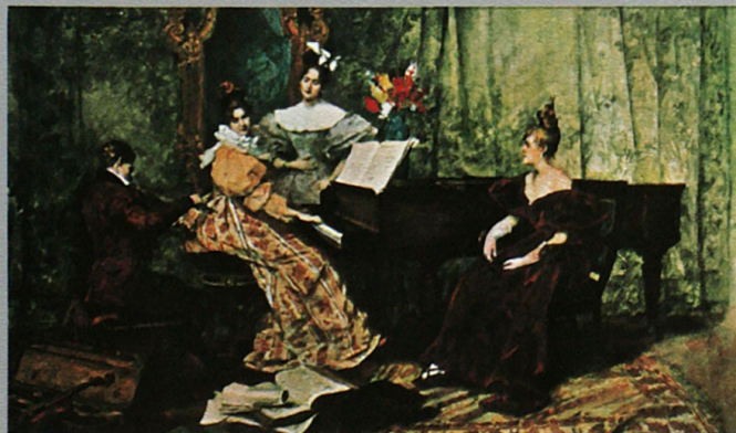
Gemälde von Madeleine Lemaire: »Musikalische Unterhaltung« (19. Jahrh.)

Giacomo Meyerbeer (1791-1864) Lieder - Melodies Dietrich Fischer-Dieskau Karl Engel, Klavier Stereo 2533 295 Neu