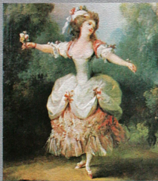
Gemälde von Jean-Honoré Fragonard: Die Tänzerin

Lamento di Tristano/Rotta, Istampite - (Sackpfeife, Fidel, Schellen u. a.) · Bassa danza (Alta-Kapelle: Blaskapelle) · Tänze für Laute, Gitarre, Vihuela, Cister von Dalza, Milan, Neusidler, Mudarra · Tänze für Virginal und Regal aus den Tabulaturen von Schmid d. A. und Paix · Tänze verschiedener Ensemble-Besetzung von Attaignant, Susato, Gervaise und Phalèse Ulsamer Collegium Konrad Ragossnig, Laute und Gitarre Stereo 2533 111 Grand Prix du Disque