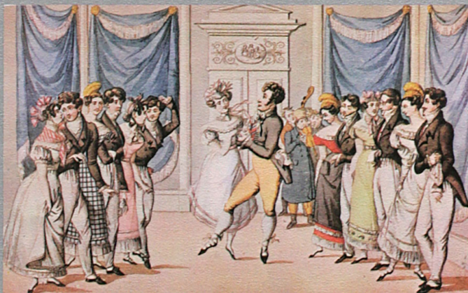
Wiener Biedermeier-Szenen: »Tanzmeister Pauxel« oder »Faschingsstreiche«

Pamer: Walzer · Beethoven: Tänze, WoO 17 »Mödlinger Tänze« · Moscheles, Deutsche Tänze · Schubert: 5 Menuette mit 6 Trios, D. 89 · Schubert: 4 Komische Ländler, D. 354 · Anonym: Linzer Tanz, Wiener Polka Lanner: Ungarischer Galopp Ensemble Eduard Melkus Stereo 2533 134 Edison-Preis