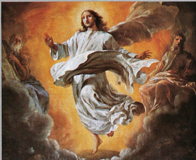
Gemälde von Johann Heinrich Schönfeld: Die Verklärung Christi (um 1680)

Suite Nr. 1 A-dur, Suite Nr. 3 d-moll, Suite Nr. 6 fis-moll, Suite Nr. 7 g-moll Stereo 2533169