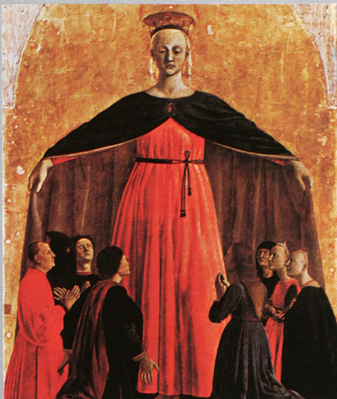
Piero della Francesca: Politico della Misericordia, part. Madonna e devoti