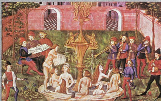
Buchminiatur aus dem Codex DE SPAERA. Musikalische Unterhaltung im Garten (15. Jahrh.)

Anthologie der bauerlichen, bürgerlichen und höfischen Tanzmusik des 15. bis 18. Jahrhunderts