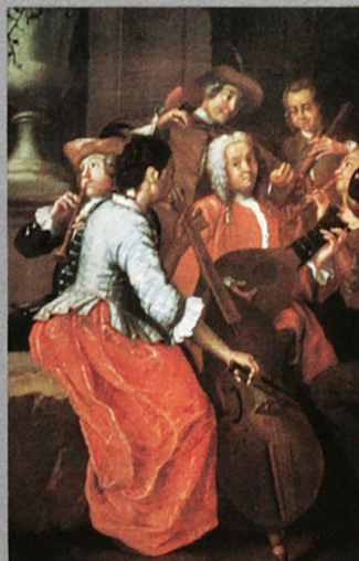
Gemälde von Peter Jakob Horemans: Das Konzert im Garten (18. Jahrh.)