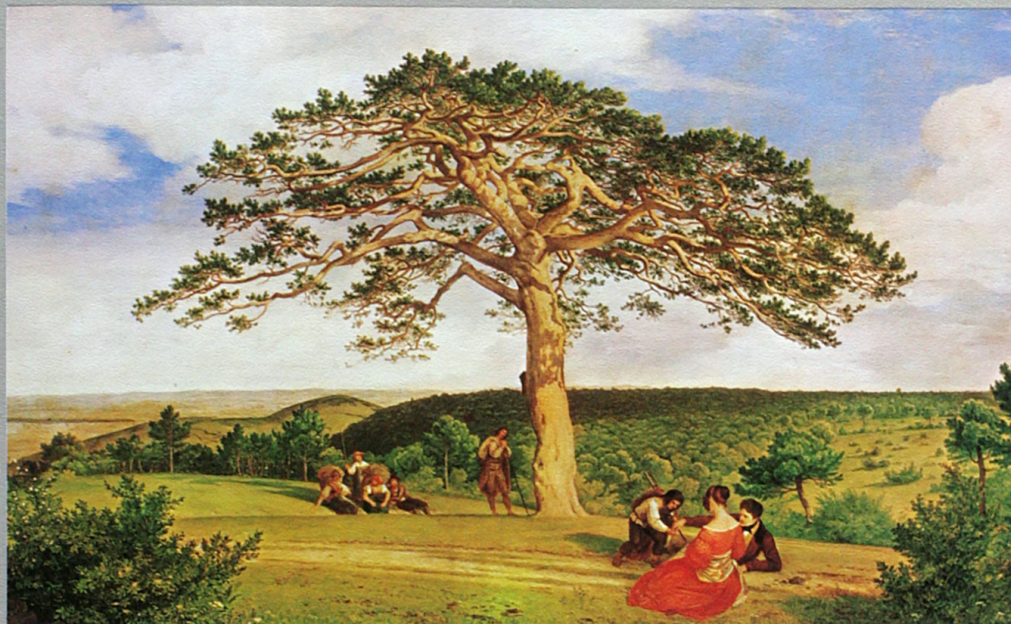
Gemälde von Ludwig Ferdinand Schnorr von Carolsfeld: Die Breite Föhre nächst der Brühl bei Mödling (1838)