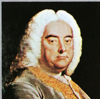
Gemälde von Thomas Hudson (1756)