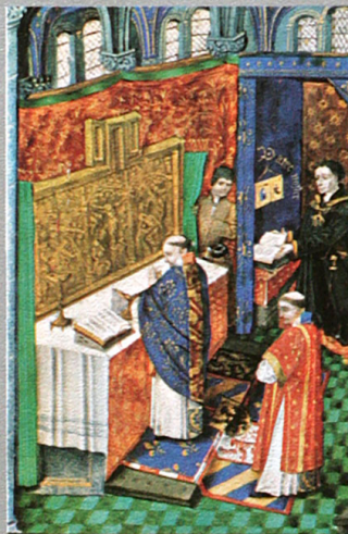
Miniatur von Jean Miélot: Philipp der Gute bei einer Messe in seiner Kapelle